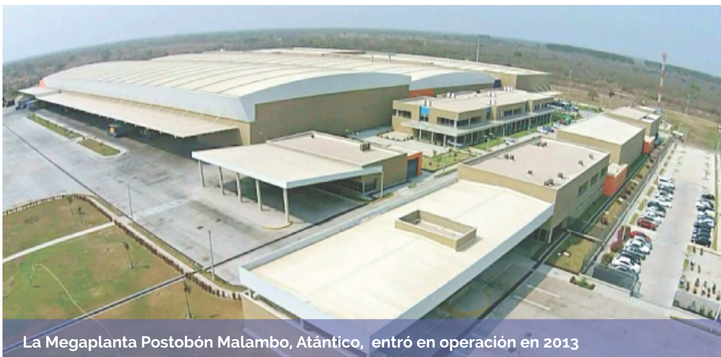
La Megaplanta Postobón Malambo, Atántico, entró en operación en 2013

El Precio del dólar finalizó el año en $1.926,83 con una tendencia al alza debido a las medidas adoptadas por la Reserva Federal Americana, tendientes a disminuir los estímulos monetarios para la compra de bonos. En 2012 el precio del dólar terminó el año en $1.768,23 y en 2011 en $1.942,70.